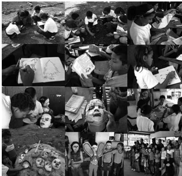
Secuencia 1. Actividades en la escuela Los Negritos: Parcelita de Observación. Coloreando. Rasgando. Haciendo mascarar y celebrando el carnaval en Las Galderas.

Parcelita de observación en el patio de la Escuela (Arago, et al., 2002); lectura libre (diferentes textos de cuentos infantiles); colorear letras; escribir palabras y frases; recortar, rasgar y pegar; representar figuras geométricas con un hilo; realizar ejercicios de motricidad fina (óvalos, círculos y trazos continuos); elaborar mascarar en la cara de su compañero. La siguiente secuencia 1 de fotografías, dan evidencia de las actividades realizadas: