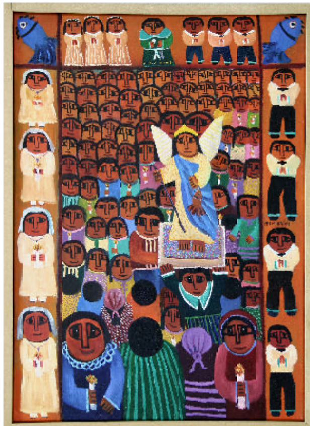
Procesión de San Rafael Anare Palmira Correa Museo de Arte Popular Salvador Valero