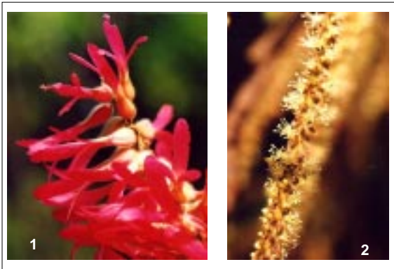
Figura 1. Flores femeninas (1) y masculinas (2) de Triplaris caracasana .