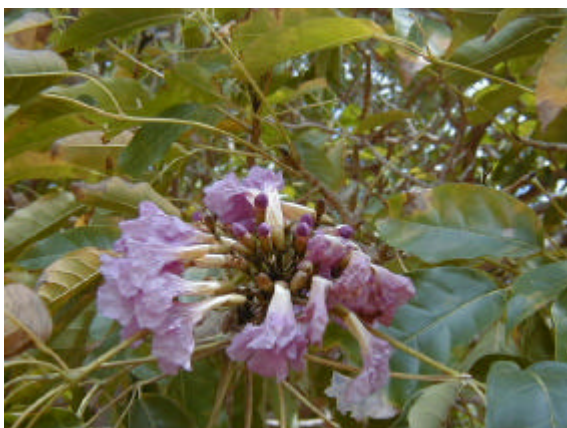
Figura 1. Tabebuia rosea en flor.

Floración: Durante los meses de Septiembre y Octubre. También se reportan los meses de Enero, Febrero, Marzo y Abril (López-Palacios, 1986), Abril y Mayo (Blanco Mavares, 1995). Posiblemente varía la época de floración en diferentes años, o inclusive hay años con dos floraciones.