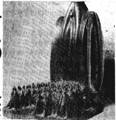
Espacio Limitado (Bronce) 1981.

Para Manuel de La Fuente el arte es trabajo permanente, es llevar una expresión a través de la que las manos del artista son capaces de hacer. Actualmente dice: se está haciendo