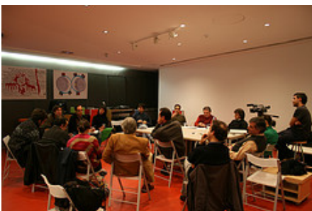
Imagen No. 3. Laboratorio del Procomún