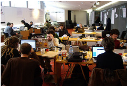
Imagen No. 1. Inclusiva-net