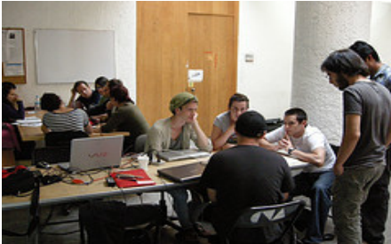
Imagen No. 4. Interactivos?