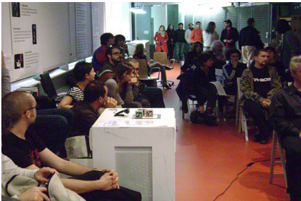
Imagen No. 5. Avalab