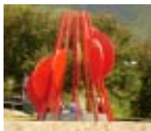
Hitos del Molino