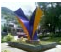
Tensión y torsión