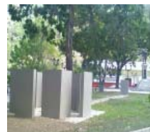
Homenaje al cuadrado y al agua de los Andes