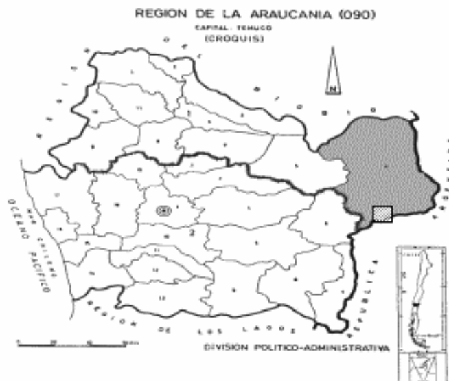
MAPA I. REGIÓN DE LA ARAUCANIA.

El estudio se realizó durante el mes de mayo del 2000 en la comuna de Lonquimay. Dicha comuna se ubica en la cordillera andina, al noreste de la IX región de la Araucanía (38°26' latitud Sur, 71°21' longitud Oeste) (MAPA I). Su super-