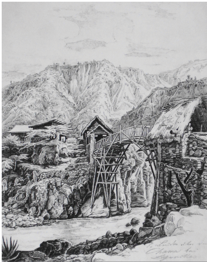
“Puente sobre el Chama cerca de Lagunillas” . En Ferdinand Bellerman. Diarios venezolanos. 1842.1845 . Caracas: Galería de Arte Nacional. 2007, p. 253.

y La Chiquinquirá; caseríos pertenecientes al municipio Obispo Ramos de Lora, a excepción del último que se encuentra en la jurisdicción del municipio Caracciolo Parra y Olmedo. 19