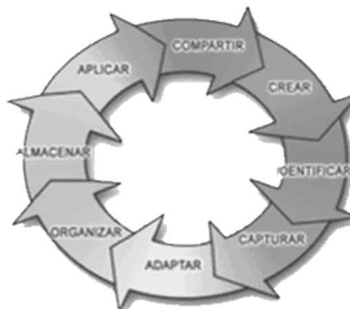
Figura 1 Ciclo del conocimiento

ciendo como algo valioso y se están invirtiendo ingentes cantidades de recursos en las diversas fases del ciclo (ver figura 1) que involucra el conocimiento desde su producción o captura hasta su uso.