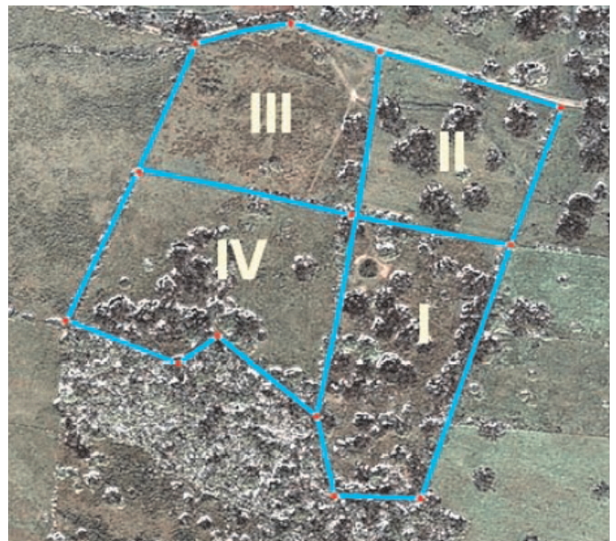
FIGURA 1. PARCELAS DELIMITADAS EL ÁREA DE ESTUDIO EN LA FINCA RANCHO ALEGRE, MUNICIPIO SAN FELIPE, YARACUY [20].

Las muestras fueron procesadas en el laboratorio de Nutrición Animal del Centro Nacional de Investigaciones Agropecuarias (CENIAP), en una muestra compuesta para cada potrero, de acuerdo a la fecha de muestreo, a las cuales se les determinó los contenidos de proteína cruda (PC) [1], fibra de-