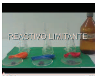
Fig. N° 3: Reactivo Limitante

Las Presentaciones (ver Figs. 4,5 y 6) fueron realizadas con la finalidad de dar a conocer el tema a los estudiantes de una manera sencilla, dinámica, colorida y entretenida, en total se realizaron tres presentaciones, una referente a la Estequiometría, reacciones químicas y ecuaciones químicas; otra referente a balanceo de ecuaciones químicas y leyes ponderales y la última referente al concepto de mol y reactivo limitante.