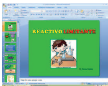
Fig N° 5: Reactivo Limitante