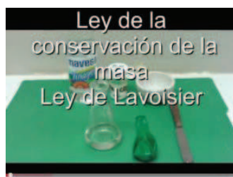
Fig. N° 2: Ley de Lavoisier