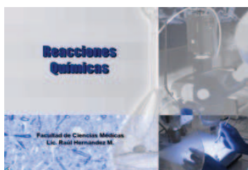
Fig. N° 6: Reacciones Químicas y Balanceo

Por último fue creado un programa interactivo (ver Figs 7 y 8). denominado “Aprendiendo a Balancear Ecuaciones Químicas” haciendo uso del programa Visual Basic 6.0, donde se presentan 12 reacciones químicas con diferente grado de dificultad. En el mismo se le pide al estudiante realizar el balanceo de cada ecuación colocando los coeficientes estequiométricos que sean necesarios, este programa tuvo como finalidad permitirle al estudiante relacionar la teoría y aplicar sus conocimientos en la práctica a través de esta actividad, lo que representa un complemento importante en la fijación del contenido por parte del estudiante.