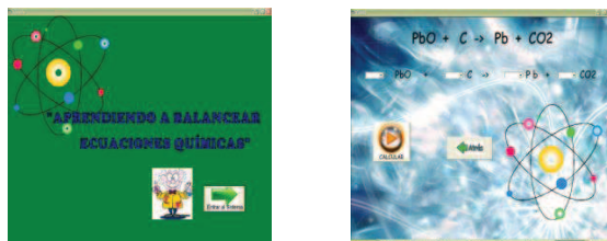
Figura N° 7 y 8: Programa interactivo “Aprendiendo a Balancear Ecuaciones Químicas

Luego de aplicadas estas estrategias con la población seleccionada se procedió a evaluar tanto al grupo control como al grupo experimental (ver Gráfico 01) para conocer la influencia del uso de estrategias basadas en las TICs. Los resultados obtenidos muestran que el grupo experimental, a quien se les aplicó las estrategias, obtuvo un 60,1% de aciertos en la evaluación mientras que el grupo control obtuvo un 44,9% de aciertos, lo que deja en evidencia que el uso de las TICs es efectivo para el proceso de enseñanza-aprendizaje, principalmente en aquellos contenidos teóricos, pues también se pudo conocer que para los contenidos netamente prácticos como reactivo limitante es necesario reforzarlos a través del uso de la pizarra. Con los resultados obtenidos se afirma entonces que la aplicación de las TICs si mejora el aprendizaje de la Estequiometría, lo que es sustentado por Grisolia y Grisolia (2009), cuando afirman en su investigación que la combinación de materiales multimedia es una opción factible para mejorar el proceso de enseñanza.