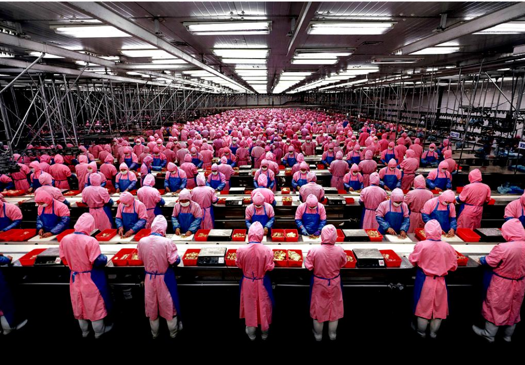
(Figura 3. Fotografía de Andrés Gursky)

Interpretando la relación conflictiva " Ciudad vs Habitante ", tomamos a la ciudad como objeto de estudio siendo éste el ente agresor y al mismo tiempo el ente agredido. Cuando hacemos referencia a la ciudad como agresora nos referimos tanto a la