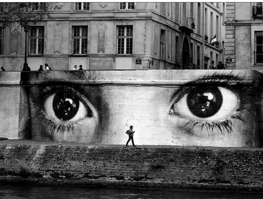
(Figura 7. Intervención en límite (muro) del artista JR en París).