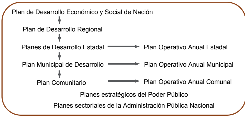
Figura N° 3: Jerarquización de los Planes de Desarrollo