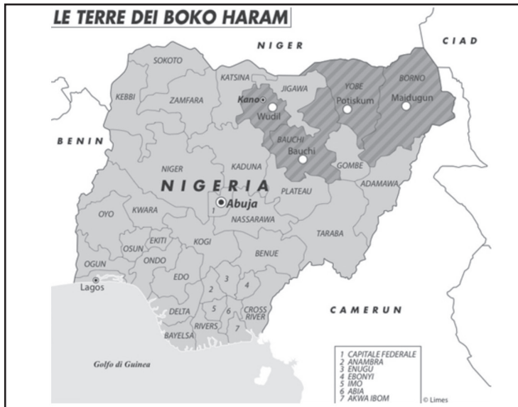
Figura 4 La estrategia geopolítica de Boko Haram