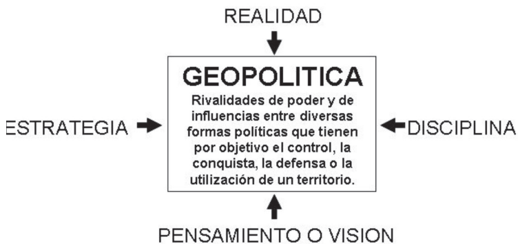
Figura 1. Las perspectivas de la geopolítica

(Figura 1): 1. La geopolítica como una realidad; 2. La geopolítica como una disciplina; 3. La geopolítica como un pensamiento o visión; y 4. La geopolítica como una estrategia.