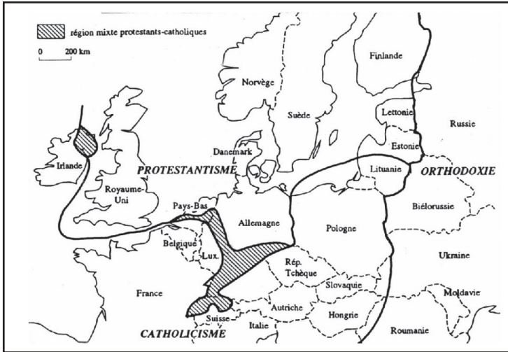
Figura 2. Fronteras del cristianismo en Europa

Fuente : Boyer, J. 1996. La frontière entre protestantisme et catholicisme en Europe . Annales de Géographie, N° 588, p. 120.