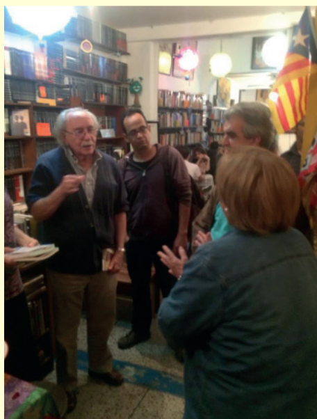
Fotografía Nº 1

Finalmente, las actividades individuales de los(as) componentes del Grupo repercutieron favorablemente en pro de éste, en virtud de que ellas fueron el soporte fundamental para la asignación de recursos a las unidades de investigación de la Universidad de Los Andes, a través del Programa de Apoyo Directo a Grupos (ADG) del Consejo de