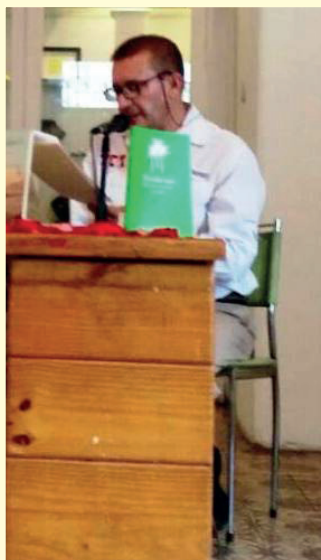
Fotografía N° 3

humanística ocupó el sexto lugar y en cuanto a las adscritas a la Facultad de Humanidades y Educación la primera posición (Véase la Tabla N° 2, en la página siguiente).