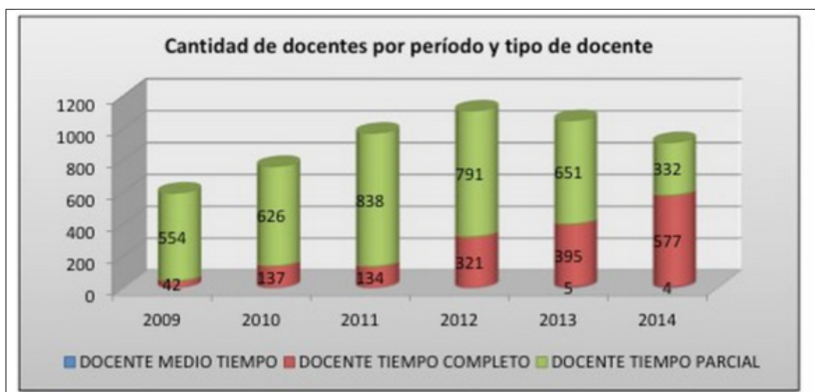
Gráfico 1 Evolución de la contratación docente en la UDLA (2009 – 2014)

Esta situación se revirtió en apenas cinco años, una consecuencia lógica del reajuste institucional a los indicadores de calidad establecidos por el Estado ecuatoriano: en 2014, un 63,19% de los docentes estaban a tiempo completo, en tanto que un 36,36% habían sido contratados a tiempo parcial, por un 0,43% de docentes a medio tiempo. El escaso interés concedido institucionalmente a la investigación se correspondía con los bajísimos niveles de productividad académica: en el año 2014, los 913 docentes de la UDLA apenas produjeron 37 publicaciones (entre artículos indexados en Scopus, en Latindex y libros evaluados por pares),