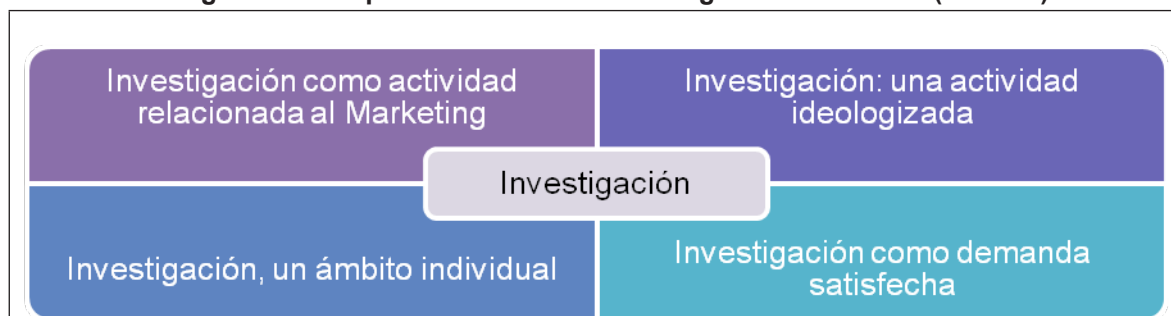
Figura 2 Categorías conceptuales del modelo investigativo de la UDLA (2014-15)

Según puede verse en el Cuadro 4 el proceso investigativo se situaba en un mismo plano significativo con respecto del “posicionamiento” de la página web. Es decir, se trataba de un ámbito relacionado con la visibilización de la producción,