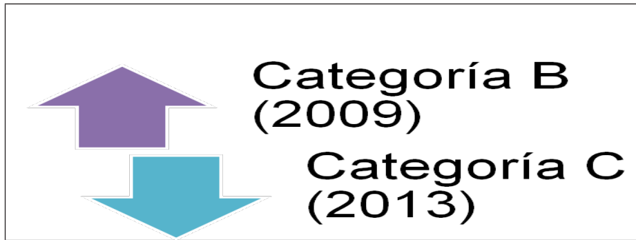
Figura 1 Evolución de la categorización de la UDLA (2009-13)