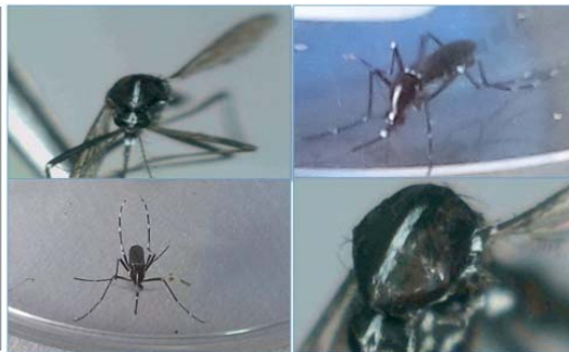
Figura 2. Vista del Mesonoto de Aedes albopictus , mostrando la línea longitudinal de escamas plateadas.