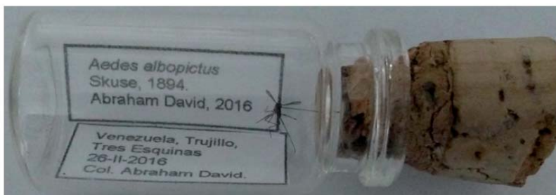
Figura 3. Montaje directo de una hembra de Aedes albopictus ..