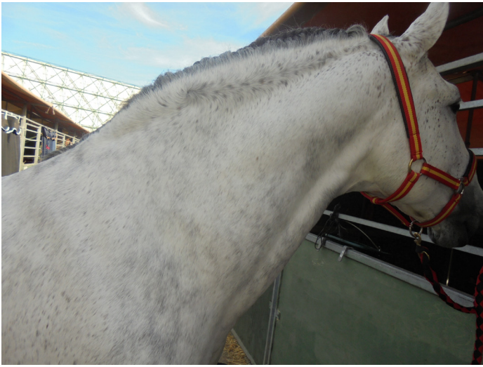
FIGURA 1. CABALLO DE PURA RAZA ESPAÑOLA CON GRADO 3 DE DEFORMIDAD DE LA REGIÓN DORSAL DEL CUELLO CARACTERIZADO POR ENGROSAMIENTO DEL CUELLO CRESTA ENGROSADA Y MÁS GRANDE. LA GRASA SE DEPOSITA MAYORITARIAMENTE EN EL MEDIO DEL CUELLO DANDO UNA APARIENCIA DEL MONTÍCULO.