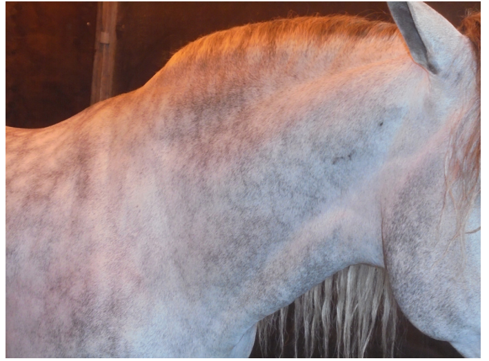
FIGURA 2. CABALLO DE PURA RAZA ESPAÑOLA CON GRADO 4 DE DEFORMIDAD DE LA REGIÓN DORSAL DEL CUELLO CARACTERIZADO POR UNA CRESTA MUY GRANDE Y ENGROSADA. LA CRESTA PUEDE TENER ARRUGAS O PLIEGUES PERPENDICULARES A LA LÍNEA SUPERIOR.

No se observaron equinos con los grados 0-2. Los resultados se presentan en detalle en la siguiente (TABLA I).