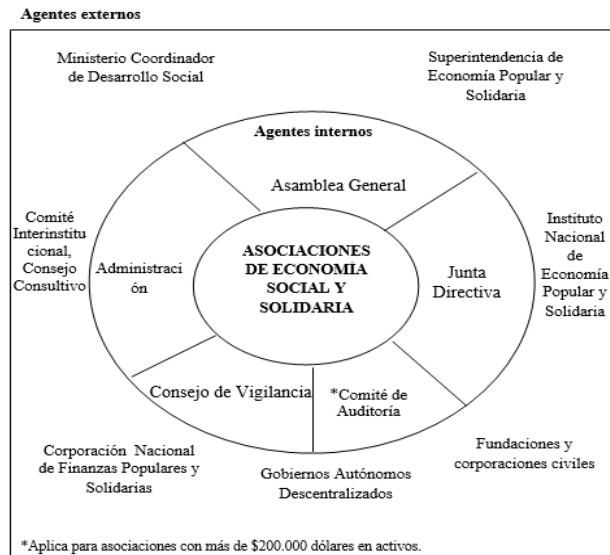
Gráfico 1. Estructura de un buen gobierno corporativo en las asociaciones de la economía social y solidaria.

Para la conformación de las asociaciones es necesario un número mayor a 10 socios y será preciso la creación de órganos de gobierno internos que colaboren con el desarrollo y el progreso de la asociación y de cada uno de los miembros. En este sentido, se conformará la Asamblea General, con todos sus miembros y será la máxima autoridad. La Junta Directiva por su parte, está encargada del sistema de gobierno y de los objetivos institucionales. Se debe designar un Presidente, un Secretario y los Vocales con un tiempo de funciones de cuatro años con opción a reelección. La Junta de Vigilancia es el órgano de control interno de las actividades económicas, y en caso de asociaciones que dispongan entre sus activos más de $200.000 deben crear un Comité de Auditoría (Superintendencia de Economía Popular y Solidaria, 2014). Finalmente, se designará un Administrador quien será el representante legal y responsable de la asociación (Gómez y Zapata, 2013).