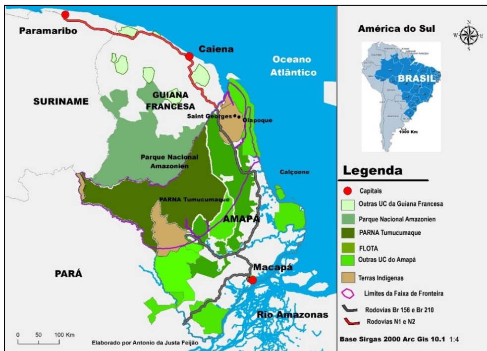
Figura 2.- Unidades de Conservação e áreas indígenas do Amapá. Adaptação: A. J. Feijão (2017).

Entende-se necessário um olhar detalhado sobre a cidade de Oiapoque sob as distintas abordagens institucionais (Municipal, Estadual e Federal) atuantes sobre a mesma. As esferas de poder correspondem às seguintes compreensões da geografia sobre as escalas geográficas.