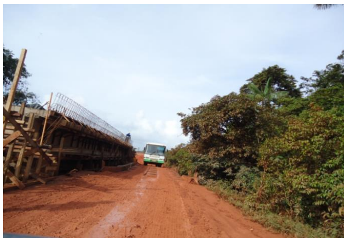
Figura 6.- BR-156. Trecho ainda não pavimentado da BR 156, até a cidade de Oiapoque.

As novas conjunturas que serão geradas no cenário sócio espacial e político em função da consolidação da BR-156 e da Ponte Binacional refletirão as implicações desse contexto de fronteira nas novas configurações da Paisagem Urbana de Oiapoque, em função dos fluxos transfronteiriços, posto que as influências das interações, mesmo difusas, sem acordos e regulamentações bilaterais definidas, já acontecem a bastante tempo entre Oiapoque e Saint Georges (Figura 6).