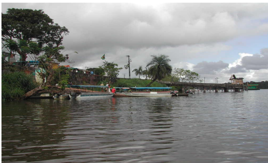
Figura 5.- Orla, rio Oiapoque.

O rio representa o meio e a mediação das interações transfronteiriças, das tramas e dos dramas socioculturais que se materializam nos movimentos pendulares na fronteira. Já como espaço simbólico, pouco resta do imaginário, das crenças, lendas, cosmologias e mitos ligados à floresta e ao misterioso universo das águas (CRUZ, 2008 apud NASCIMENTO, 2009), pois, as atenções estão agora voltadas para a dinâmica das interações transfronteiriças, na qual o rio parece representar, tão somente, via de comunicação e limite natural entre as duas cidades (Figura 5).