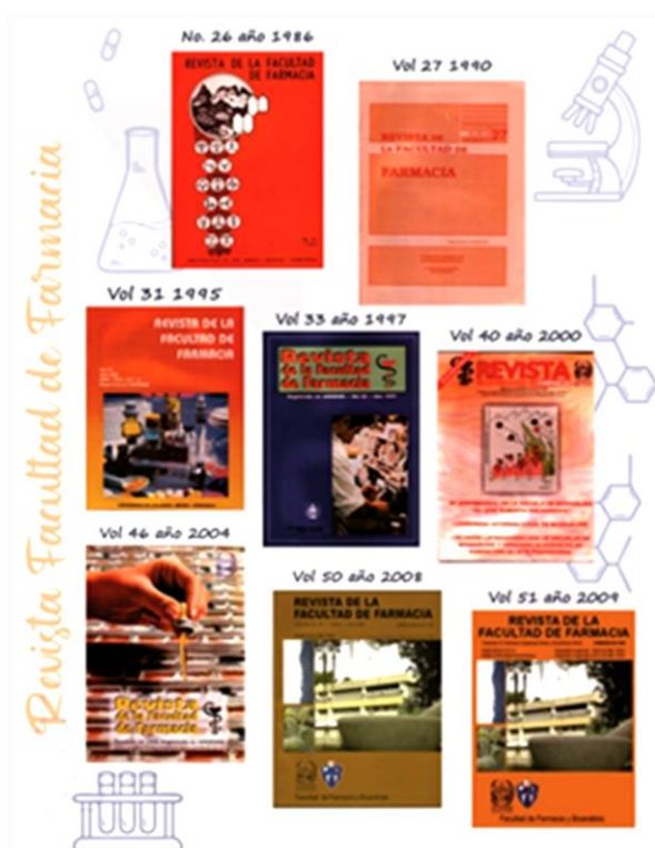
Fig. 1: Imágenes de la Revista de la Facultad de Farmacia desde su primera edición, año 1958, hasta la actualidad.

diseño que conserva el color naranja distintivo e incluye una foto representativa de la Facultad de Farmacia y Bioanálisis (Fig. 2).