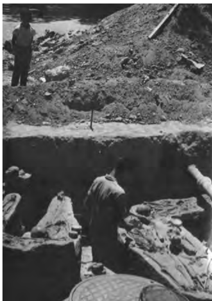
Excavaciones de la primera jornada 1965-1975.