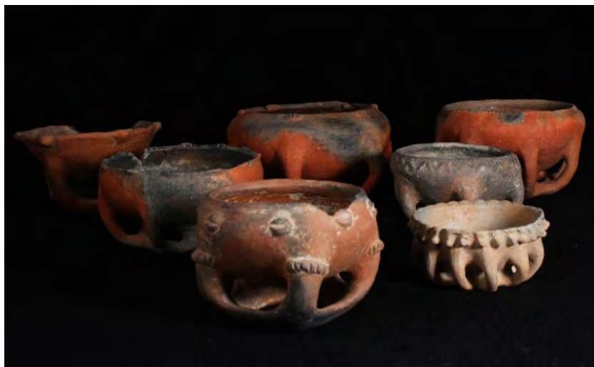
Cerámica de la Fase Boulevard.

estilística; traducido en 16 formas diferenciables (Toledo, 1995); en cuanto al acabado: la decoración es principalmente plástica; escasa o nula decoración con pintura; el ahumado con fines estilísticos y erosión apenas presente debido a la utilización del alisado y/o pulido.