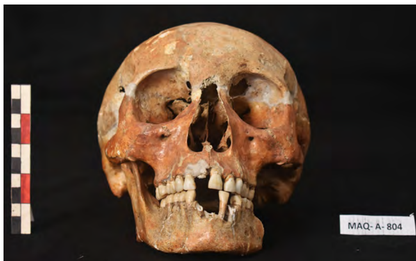
Cráneo con pigmentación ósea rojiza.

En consecuencia, la poca presencia de estos enterramientos en nuestra muestra dan cuenta que es una práctica funeraria extraordinaria. Hay autores que lo adjudican a variables etarias y ciertos tipos paleopatologías, por lo que se ha considerado como un símbolo de diferenciación social dentro de la comunidad (Gil, 2003), correspondiendo a lo observado.