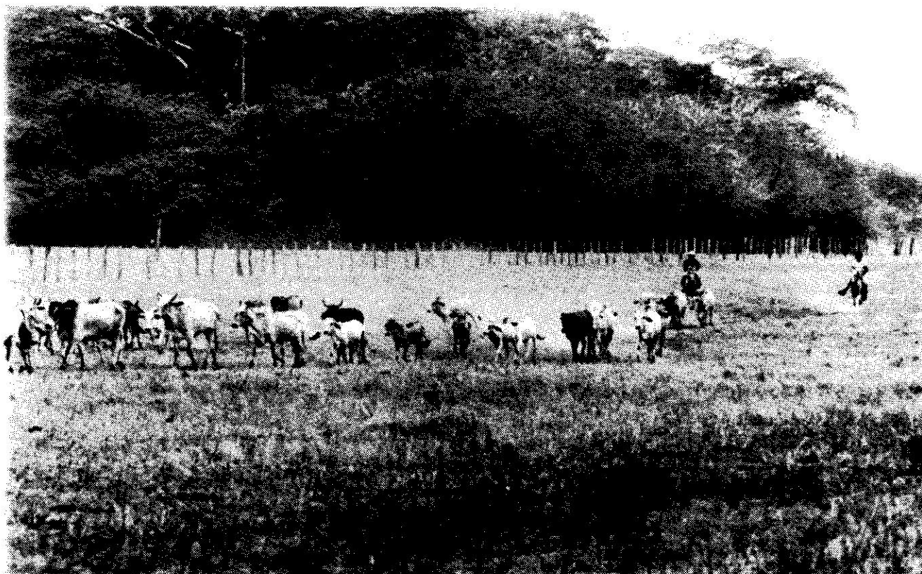
Llano - "Punta de Ganado"