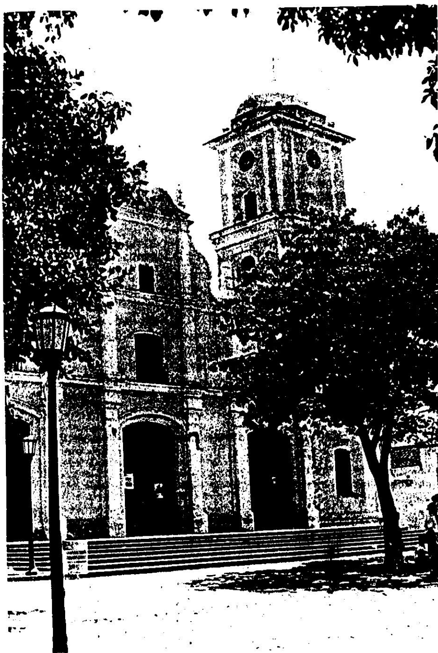
IGLESIA DULCE NOMBRE DE JESUS, PETARE EXCAVACIONES ARQUEOLOGICAS: INFORME II CARMEN L. FERRIS, OCTUBRE 1989