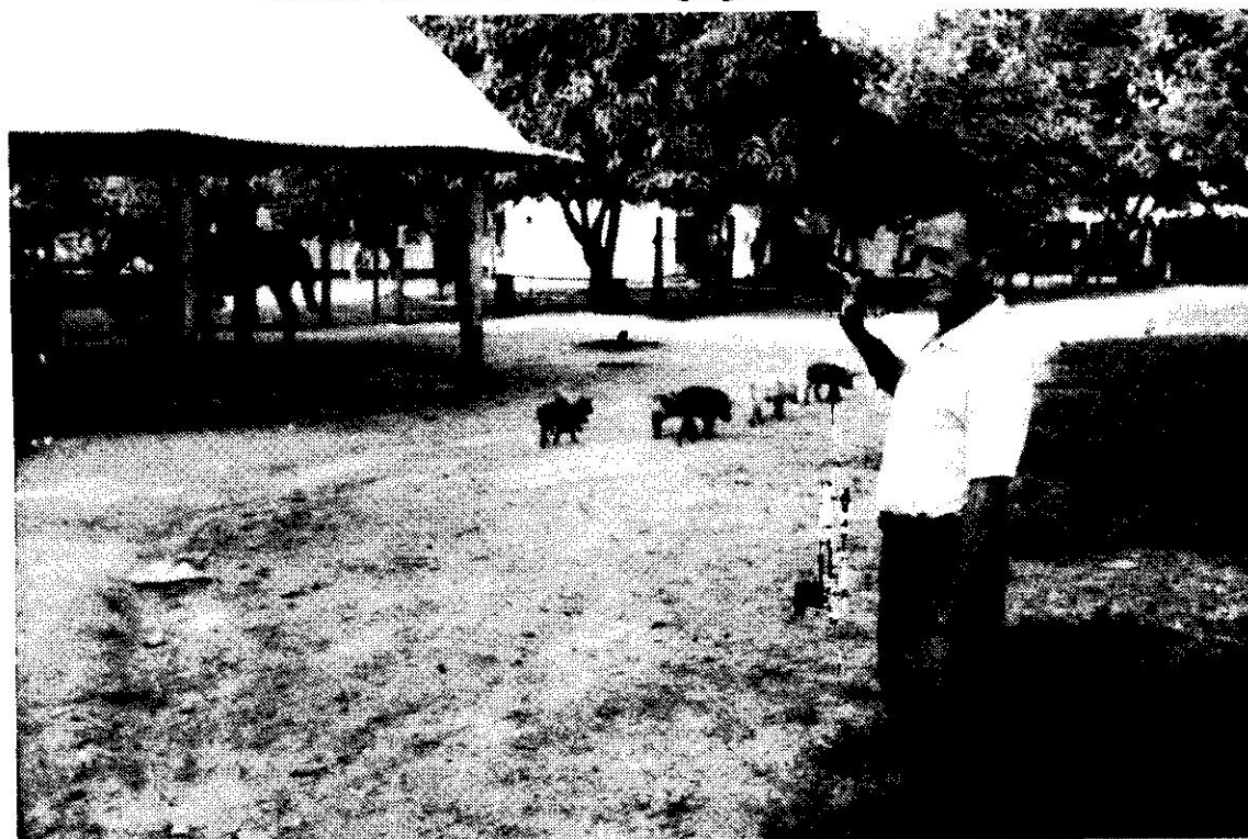
Llanero rezando patio de animales