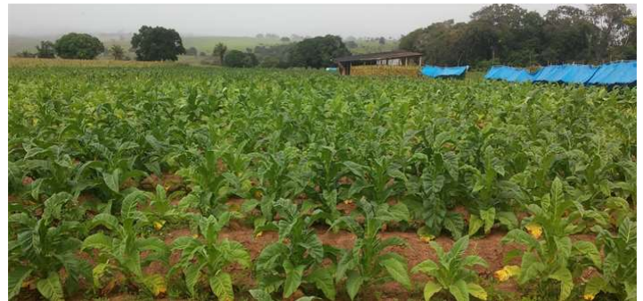
FIGURA 3. Plantação de fumo na Região Geográfica Imediata de Arapiraca (Taquarana/AL). Fonte: pesquisa de campo, 2020

outras culturas hoje mais expressivas, a exemplo do milho, do feijão e da mandioca, e apresentando uma produção mínima se comparada com os períodos do seu apogeu nessa região. Do mesmo modo, a feira livre também