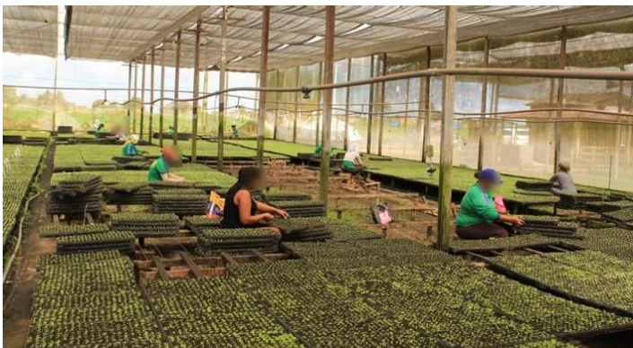
FIGURA 4. Projeto Cinturão Verde: estufa de mudas de hortaliças (Arapiraca/AL).

De acordo com Oliveira (2007), o Projeto Cinturão Verde (FIGURA 4), que objetiva principalmente a disponibilidade de água subterrânea e equipamentos de irrigação para o plantio de hortaliças por agricultores familiares, utilizando também recursos da Companhia de Desenvolvimento dos Vales do São Francisco e do Parnaíba (CODEVASF) 14 , tem possibilitado a melhora das condições sociais e econômicas em Arapiraca, permitindo uma produção satisfatória que vem contrabalanceando os efeitos negativos da decadência fumageira e criando um polo de produção de hortaliças 15 .