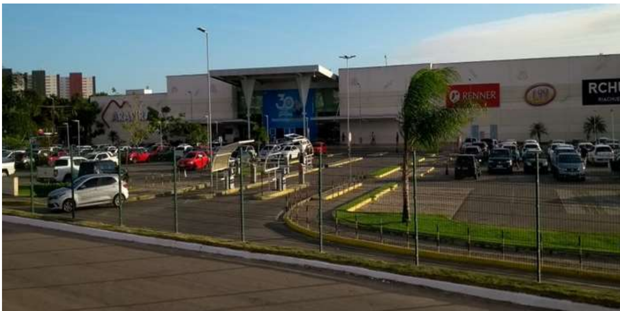
FIGURA 5. Arapiraca Garden Shopping.

Arapiraca também centraliza a oferta de serviços médicos especializados para grande parte do interior