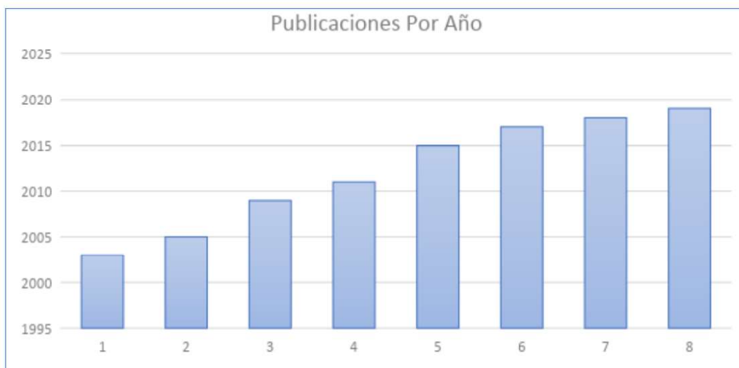
TABLA 1. Publicaciones por año, revisadas en el marco del estudio.

2) El otro aspecto tiene que ver con la investigación aplicada sobre ‘el desarrollo y evaluación de métodos de enseñanza y materiales en campos que incluyan nuevas informaciones tecnológicas, educación medioambiental, para el desarrollo y estudios interculturales y globales’. La Declaración Internacional sobre Educación Geográfica para la diversidad cultural incide más en la visión de la educación geográfica en mejorar la capacidad de todos los ciudadanos para contribuir a crear un mundo justo, sostenible y agradable, pero desde el respeto a la diversidad cultural, y a los estilos de vida y contextos sociales de los diferentes pueblos del planeta Tierra; de acuerdo con esto, la diversidad cultural, representa entonces, el contenido geográfico esencial para conocer y comprender la forma