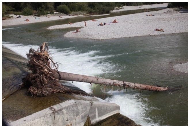
FIGURA 5. Cauce y riberas del río Isar en Múnich.

En las primeras fases, la Agencia Estatal del Agua emprendió una serie de acciones encaminadas a ensanchar el cauce creando una sección hidráulica adecuada, eliminando muros de hormigón y aportando gravas. Se incorporó materia vegetal muerta (troncos y tocones) para crear nuevos hábitats para animales y plantas. Se aterrizaron algunas praderas para facilitar el acceso de las personas al agua. Se sustituyeron los antiguos diques transversales por barreras de escollera. Finalmente, la calidad de las aguas se mejoró mediante la incorporación de tratamientos con rayos ultravioletas (Binder, 2004), (FIGURA 5).