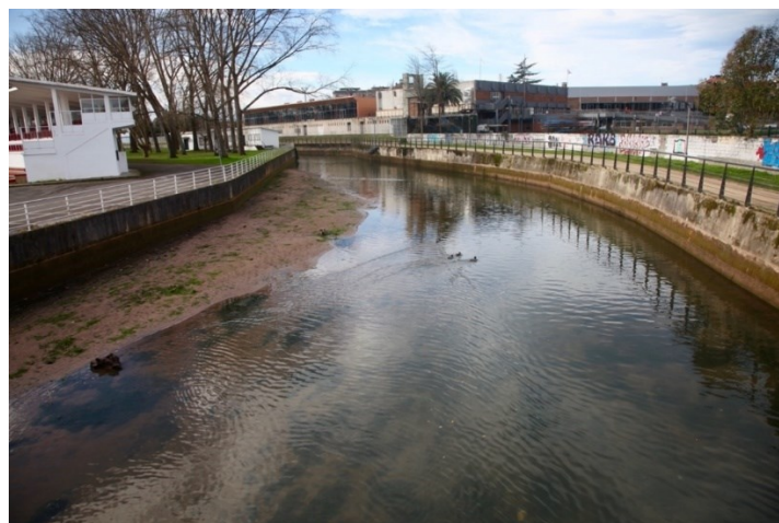
FIGURA 3. Encauzamiento del río Piles en Gijón.

La recuperación ambiental del río Piles a su paso por Gijón con la inclusión compatible de los usos deportivos náuticos, representa un importante desafío para la ciudad. El estado hidrobiológico e hidrogeomorfológico del río Piles en el tramo urbano de Gijón, tras décadas de agresiones ambientales y abandono, presenta episodios de alta contaminación en la zona intermareal desde el Anillo Navegable de Gijón hasta la desembocadura en la playa de San Lorenzo. La carga contaminante procede de los aliviaderos de la red unitaria de aguas residuales y pluviales (FIGURA 3).