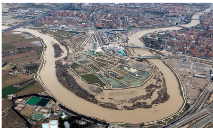
FIGURA 4. Parque del agua, Zaragoza.

proyecto se desarrolló conforme a unos objetivos muy claros: garantizar la evacuación de los caudales de la cuenca superior, defender la población y los bienes de la ciudad extendida sobre la llanura de inundación, devolver la naturalidad del paisaje y aprovechar las energías del sistema natural, mantener y potenciar el patrimonio cultural, procurar la diversidad en la forma y en el tratamiento de los distintos tramos en función de sus características naturales y culturales, facilitar la accesibilidad al espacio y la continuidad longitudinal y transversal de los paseos, promover e integrar funciones múltiples y compatibles para satisfacer los gustos y necesidades de los ciudadanos y garantizar su rentabilidad en términos ecológicos, sociales y económicos (FIGURA 4), (Pellicer, 2018 y 2018a).