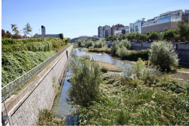
FIGURA 2. Madrid-Río. Renaturalización del cauce.