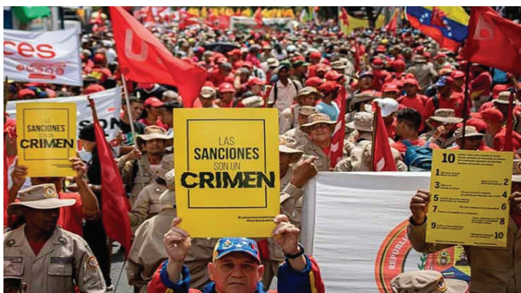
Imagen 10. VTV. Marcha sanciones [Internet]. 2022 [citado 28 diciembre 2022]. Disponible en: https://www.vtv.gob.ve/wp-content/uploads/2022/05/Protesta-en-Venezuela-contras-las-sanciones-de-EEUU.-PL.jpg

La situación escalará tras las múltiples objeciones al evento electoral registrado en el año anterior, donde en un ambiente de intervención a partidos políticos, inhabilitaciones, y ventajismo político del partido de gobierno 29 , un aproximado de 60 países desconoce la legitimidad del Estado venezolano, lo que se traduce en una ruptura de relaciones diplomáticas. Varios países se suman a las restricciones de comercio o intercambios con Venezuela. Nuevamente, el Estado utiliza la propaganda oficial para afianzar su discurso de “resistencia”: asegura que las sanciones son “contra Venezuela” y no contra jerarcas específicos, utiliza eslóganes como “las sanciones son un crimen”, y las utiliza de fondo en alocuciones televisadas y en cintillos de algunos programas televisados afectos al gobierno ( La Hojilla , Con el mazo dando , etc). También, organizan “manifestaciones de calle en repudio a las sanciones” donde se hace pública la participación de la ideologizada Milicia Nacional Bolivariana (ver imagen 10).