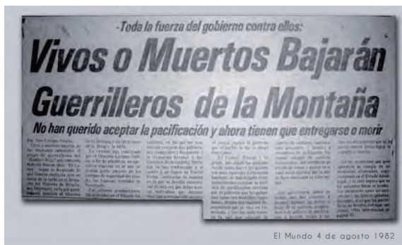
Imagen 3. Ibidem , p. 74.