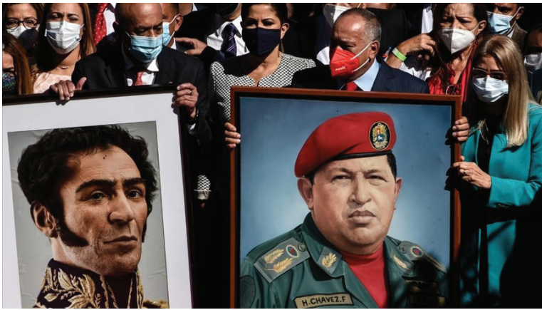
Imagen 5. Agencia Anadolu. Cuadros de Bolívar y Chávez en la Asamblea Nacional [Internet]. 2021 [citado 28 diciembre 2022].

De entrada, se observan paralelismos con presidentes militares: Pérez Jiménez, sobre todo en lo tocante a la figura del líder (caudillo) como eje central de la imagen (imagen 5). Pero se le añade, además, la nostalgia independentista, equiparando al caudillo Hugo Chávez con el padre de la patria (Bolívar).