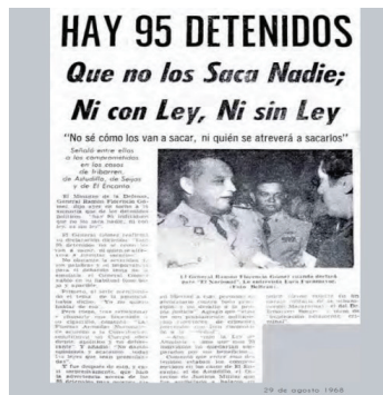
Imagen 2. Ibidem , p. 65.