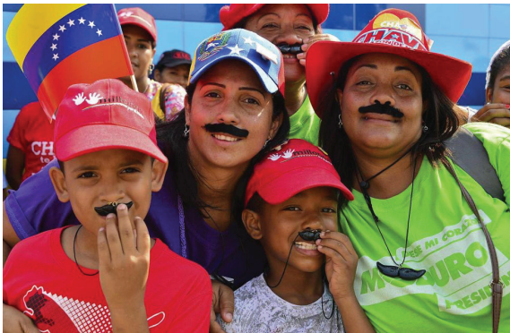
Imagen 8. El País . Simpatizantes en acto de campaña [Internet]. 2013 [citado 7 de febrero 2023]. Disponible en: https://ep00.epimg.net/internacional/imagenes/2013/04/12/album/1365793689_920268_1365796025_album_normal.jpg

Visto también en la necesidad de crearse una simbología propia -el sobrevivir adaptándose a la del caudillo militar tiene un alcance limitado-. Pues, en las elecciones de 2013 se hace un rudimentario (por lo tosco y poco preparado en relación con los símbolos que utilizaba Chávez) acercamiento a identificarse con el pueblo con la figura del bigote. Dos momentos propagandísticos sobreviven a la par: el rojo característico desde 1999, y, el bigote del nuevo líder del partido (ver imagen 8).