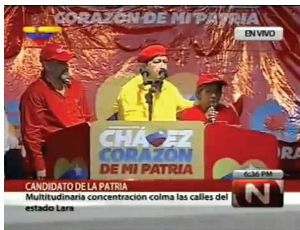
Imagen 6. Youtube. Discurso de Hugo Chávez en campaña (VTV) [Internet].

2012 [citado 28 diciembre 2022]. Disponible en: https://www.google.com/url?sa=i&url=https%3A%2F%2Fwww.youtube.com%2Fwatch%3Fv%3D4wXCldHY5kY&psig=AOvVaw1x_iNUUNOAHhF8BkucfKm&ust=1672319685825000&source=images&cd=vfe&ved=0CBAQjRxxqFwoTCIiyhrmynPwCFQAAAAAdAAAAABA2