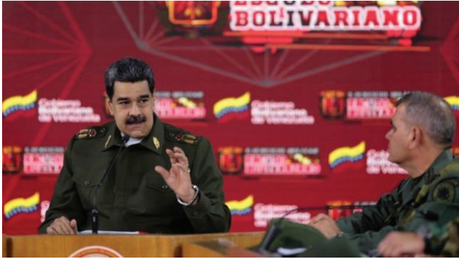
Imagen 7. Alocución Nicolás Maduro [Internet]. 2020 [citado 28 diciembre 2022]. Disponible en: https://ichef.bbci.co.uk/news/800/cpsprodpb/DC0F/production/_110953365_tv060016973.jpg

Visto también en la necesidad de crearse una simbología propia -el sobrevivir adaptándose a la del caudillo militar tiene un alcance limitado-. Pues, en las elecciones de 2013 se hace un rudimentario (por lo tosco y poco preparado en relación con los símbolos que utilizaba Chávez) acercamiento a identificarse con el pueblo con la figura del bigote. Dos momentos propagandísticos sobreviven a la par: el rojo característico desde 1999, y, el bigote del nuevo líder del partido (ver imagen 8).