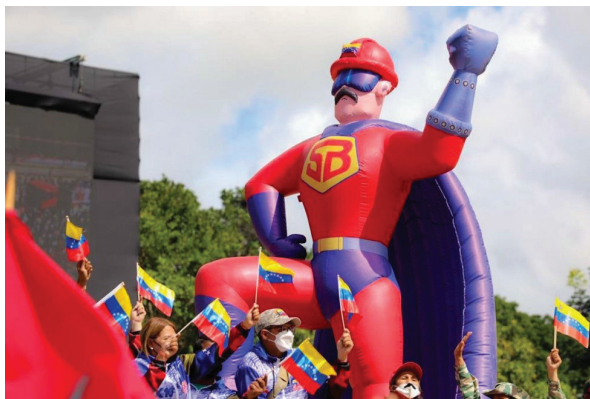
Imagen 11. Noticias A Simple Vista. Inflable Marcha Chavismo [Internet]. 2022 [citado 28 diciembre 2022]. Disponible en: https://www.asimplevista.com/wp-content/uploads/2022/07/super-bigote-1410x793.jpeg

realidad en la psiquis social, y así distorsionar la percepción de la Historia de Venezuela. La misión de los científicos sociales, hoy en día, es estar atentos con su presente y deconstruirlo.