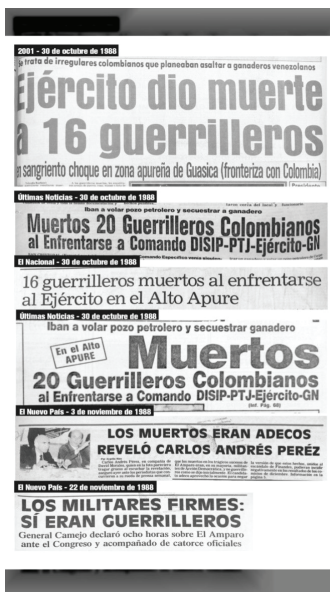
Imagen 4. Portadas que recogen información sobre el suceso de El Amparo [Internet] [citado 7 febrero 2023].

pular la percepción de la opinión pública, en titulares de prensa que recogen los partes del Estado, relacionados a la masacre de El Amparo, en 1988: