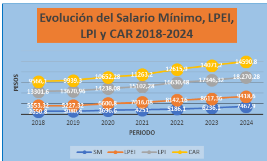
Gráfica 1. Evolución del Salario Mínimo, LPEI, LPI y CAR 2018-2024.

Fuente: Elaboración con base en Coneval (2024), CAM (2024, octubre 1). Los montos son mensuales y para familias de 4 integrantes.