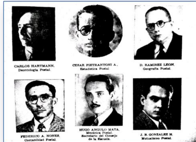
Fig. 4. Profesores de la Escuela Postal Venezolana

Fuente: Martin J. Gornes Mac-Pherson, Catecismo Postal. Historia del Correo de todos los tiempos (Caracas: Elite, 1941), XXXIX.