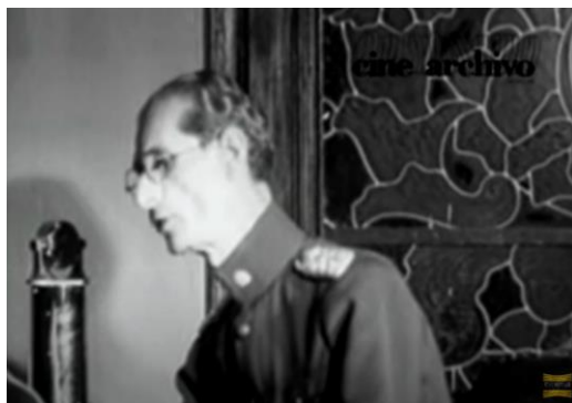
Fig. 1. Eleazar López Contreras en la Radio, 1935.

En cuanto a las políticas de gobierno del Programa de Febrero presentado en 1936, se exponen la visión del gobierno nacional, a través de la creación de instituciones, al establecerse una nueva constitución. Como señaló Luis Peña, el “Programa de Febrero” como se le llamó, tuvo unos efectos políticos inmediatos para el gobierno de López Contreras, pues logró reducir considerablemente el clima de oposición existente, aún cuando algunas organizaciones políticas continuaron proponiendo programas de mayor democratización política y económica para el país. En todo, el “Programa de Febrero” fue el primer gran proyecto de reformas del Estado moderno en Venezuela. 8