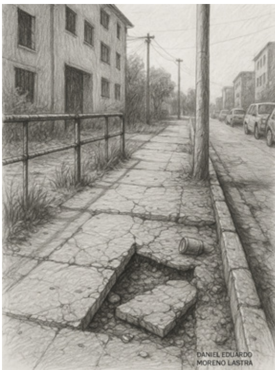
Ilustración urbana en grafito por Daniel Eduardo Moreno Lastra. Escenario que refleja la invisibilización del peatón en muchas ciudades latinoamericanas. La ausencia de infraestructura adecuada, el deterioro del entorno y la priorización del tráfico vehicular colocan al caminante en una situación de vulnerabilidad cotidiana.

Para reforzar visualmente la contradicción entre las prácticas cotidianas del caminar y la escasa atención institucional a lo peatonal, se presenta a continuación una ilustración que sintetiza, desde el trazo artístico, el abandono sistemático de la infraestructura caminable en nuestras ciudades.