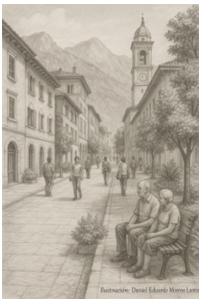
Ilustración urbana en grafito por Daniel Eduardo Moreno Lastra. Representación simbólica de un entorno caminable, donde el espacio público se humaniza a través de la presencia activa del peatón. La imagen evoca una atmósfera de dignidad urbana, inspirada en el paisaje urbano andino con referencias europeas, resaltando el valor del caminar como acto cotidiano y político.

La siguiente ilustración busca acompañar esta reflexión visualizando simbólicamente los principios discutidos: