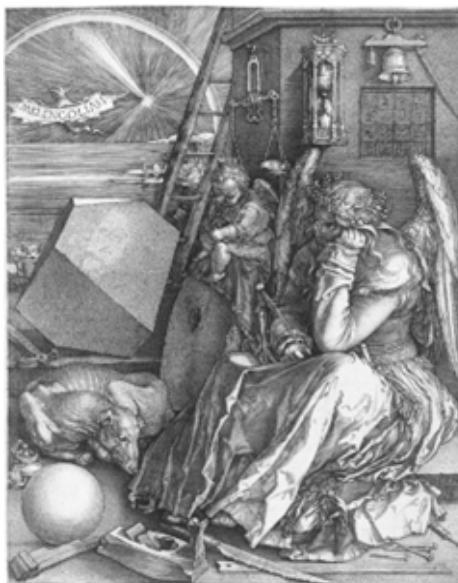
Imagen 1: "Melancolía I" (1514) Alberto Durero. Grabado (24 x 18.80 cm.)

Su obra grabada, que incluye series como "La Pasión" y "Apocalipsis", así como obras individuales como "San Jerónimo en su estudio" (1514) "Melancolía I" (1514), la cual forma parte de la serie Estampas Maestras realizada, siendo la más enigmática y de la que más interpretaciones se ha realizado. Esta obra en particular carga consigo una complejidad y simbolismo, tanto por la ejecución de la técnica como por abordar el tema de la melancolía, uno de los estados de ánimo más importantes de la época.