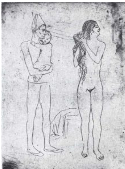
Imagen 2: Suite de los saltimbanquis (1905) Pablo Picasso. Aguafuerte, Imagen extraída de: TANDEM antigüedades y arte moderno.

Hablar sobre Picasso y sus facetas de artista, podría llevar toda una revista y nos faltaría espacio, pero antes de cerrar estas líneas, me permito aludir que la técnica de "Taco perdido" o también llamado "placa perdida" corresponde a una de sus contribuciones técnicas en la optimización del tiempo y la estampación del color, todo esto aunado a su destreza.