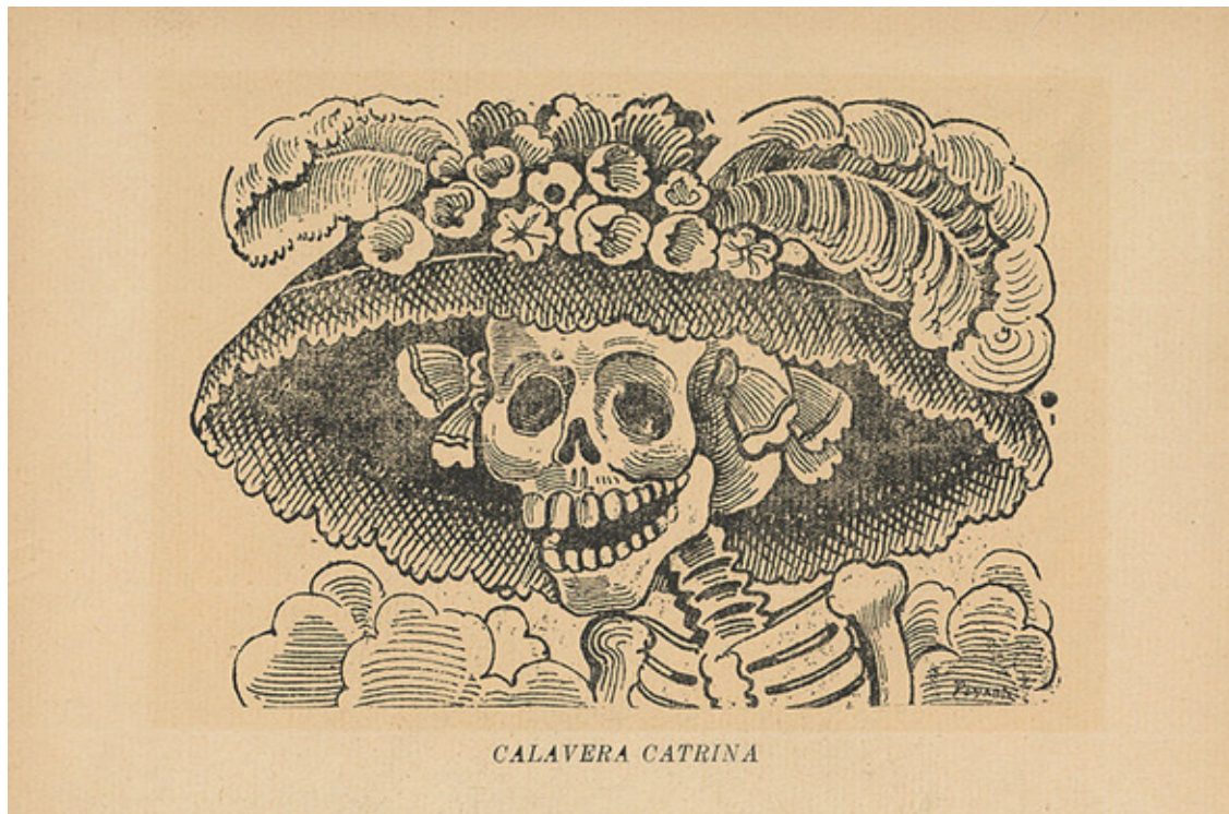
Imagen 5: La Calavera Garbancera mejor conocida como “La Calavera Catrina”(1912)

De esta forma podemos constatar que la técnica del garbado no solo ha plasmado su voz en las artes y la belleza, sino que ha traspasado las barreras de los ámbitos sociales y a establecido su pregnancia en los elementos identitarios.