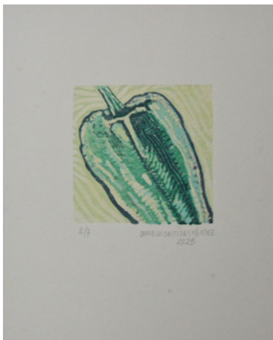
Imagen 4: "Sin título" (2025) Carmelo Bastidas Méndez

Sus trabajos de rostros, paisajes muestran un rango de sensibilidad y conexión con el concepto generador, pero que no escapa de llevar la firma indeleble del estilo y leguaje grafico del artista Carmelo, su destreza se manifiesta en la cantidad de grabados y las series que lo hacen ser un artista activo, siempre estudiando y buscando refrescar la mirada en la obra.