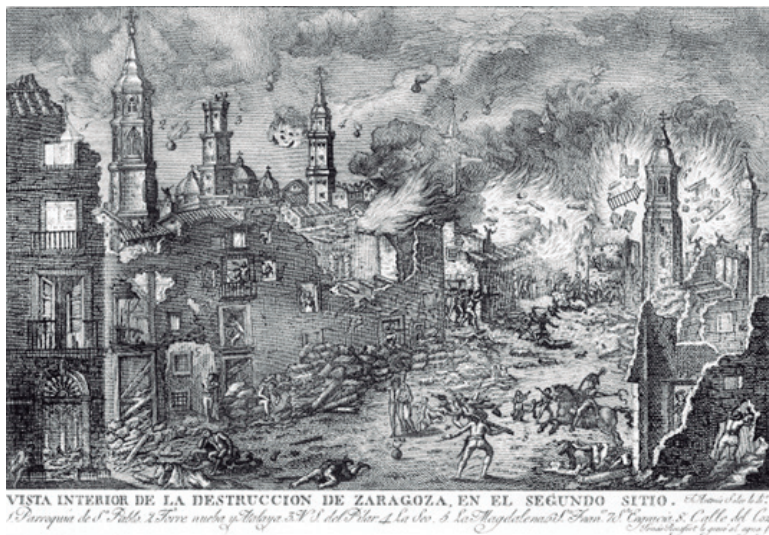
Figura 6. Vista de la destrucción de Zaragoza, en el segundo sitio, dibujo de José Antonio Soler, grabado por Rocaford y López en Valencia, en 1809.