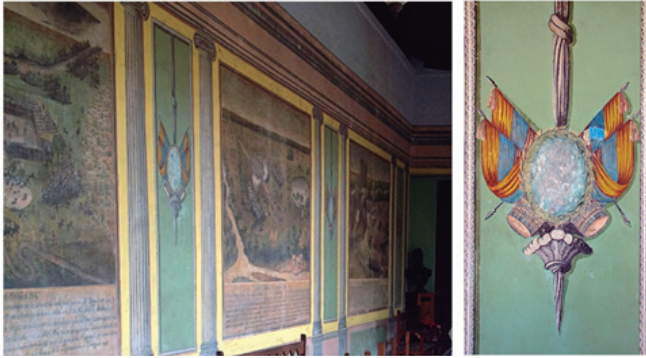
Figura 9. Medallón en pintura mural de templo de 1829, que evidencia el borrado del retrato de el general José Antonio Páez, por mandato de los Monagas.

Solo los graffiti de los sótanos se han preservado en muy buenas condiciones, gracias a que no reciben luz directa de ningún modo, ni natural ni artificial. El único aspecto que las pone en riesgo es que los transeúntes de la casa pueden tocar las paredes, por no poseer dispositivos que los aislen de posible contacto inescrupuloso, por quienes visitan el museo; se evidencia que las restauraciones de los muros han tapado parte de los graffiti (Figura 9).