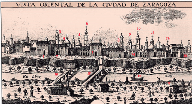
Figura 5. Zaragoza en el siglo XVIII seguía siendo la ciudad de las torres como lo demuestra esta vista realizada en 1779 por Juan Fernando Palomino. La número 10 representa a la Torre Nueva.

En el libro de Alberto Serrano Dolader (1989), se puede apreciar variadas estampas de la ciudad de Zaragoza mostrando la Torre Nueva (Figura 5), así como la guerra desarrollada por el Imperio Francés (Figura 6). La población resistió el Primer Sitio (1808), infringiéndole derrota al enemigo, pero el Segundo Sitio no lo resistió, debido a que la Capital de Aragón ya había caído en manos de los franceses, fue entonces que febrero de 1809 se da la capitulación de Zaragoza. Estos sitios se consideran los más representativos de la Guerra de Independencia Española.