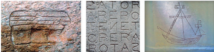
Figura 1. Graffiti del mundo antiguo: Malta, Roma e Inglaterra.

En los últimos veinte años se ha podido conocer un gran número de graffitis históricos en todo el mundo antiguo, tales como el graffiti de un templo en Malta; el cuadrado SATOR, un grafito escrito en latín como palíndromo dentro de un cuadrado mágico y encontrado en numerosos sitios a lo largo del Imperio Romano; así como el graffiti de un barco (entre muchos otros), de los siglos XIV al XVI que ha sido estudiado recientemente en Norfolk, Inglaterra. (Figura 1).