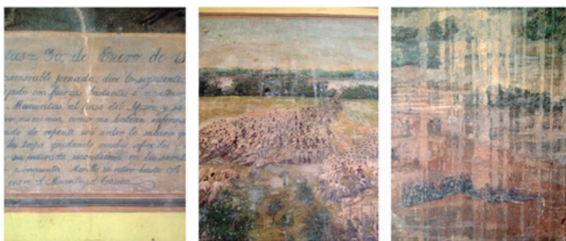
Figura 8. Pintura mural en Temple (detalles) de 1829, realizada por Pedro Castillo bajo las indicaciones directas del general Páez: Batalla de Mucuritas. Fuente: Autor.

Como se ha mencionado antes, la casa posee un sótano el cual se divide en cuatro naves, comunicadas cada una, por una puerta central hasta el patio; una de las naves tiene entrada secreta a la habitación principal del general Páez; en ellas se pueden observar diversidad de dibujos, así como escritos en castellano y francés en las tres últimas naves, en las cuatro paredes de cada nave.