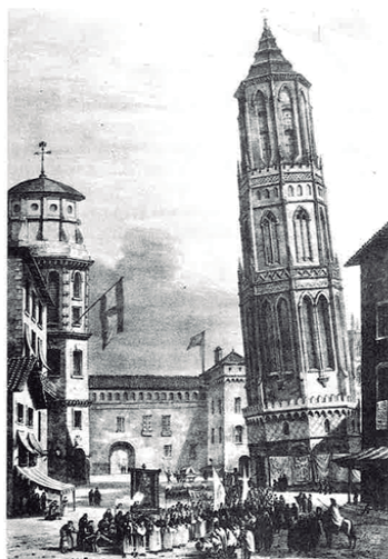
Figura 7. Dibujo de Edward Hanker Locker de su libro Views in Spain , publicado en Londres en 1924. Fuente: La Torre nueva de Zaragoza . Alberto Serrano Dolader. Zaragoza 1989.