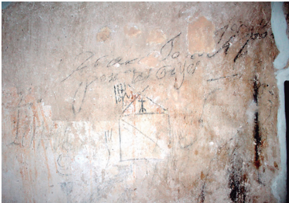
Figura 10. Graffiti ubicado en el sótano de la casa Páez; se desconoce su origen; el sótano fue utilizado como calabozo por parte de la policía del régimen del presidente Juan Vicente Gómez en 1929.

Solo los graffiti de los sótanos se han preservado en muy buenas condiciones, gracias a que no reciben luz directa de ningún modo, ni natural ni artificial. El único aspecto que las pone en riesgo es que los transeúntes de la casa pueden tocar las paredes, por no poseer dispositivos que los aislen de posible contacto inescrupuloso, por quienes visitan el museo; se evidencia que las restauraciones de los muros han tapado parte de los graffiti (Figura 9).