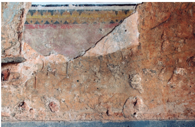
Figura 3. Grafito encontrado debajo de la superficie perteneciente al período de 1829, por lo que se presume puede pertenecer al año 1812 (año del terremoto) o incluso finales del siglo XVIII (Hospital de caridad).

bajo un estudio minucioso y con el uso de la fotografía infrarroja, es seguro poder revelar estos signos.