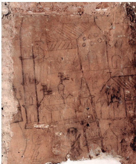
Figura 4. Graffiti histórico en Casa de la Estrella, representando diferentes fachadas de carácter eclesiástico; al centro se observa la torre inclinada.

la conocida Torre Nueva de Zaragoza, se pudo constatar que definitivamente, se trataba de una ilustración del Sitio al que se vio sometida esta ciudad durante la Guerra de Independencia Española entre 1808 y 1809; precisamente los años previos a la Independencia de Venezuela iniciada en 1810.