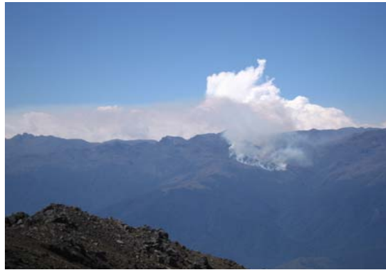
Aerosol producto de la quema de vegetación en la Sierra Nevada. Smoke Aerosol from Biomass Burning at the Sierra Nevada. Marzo, 2007. March, 2007

The Swedish participation is funded by the Swedish Research Council (VR) and by the Swedish International Development Cooperation Agency (SIDA). The German participation is or was founded by the Federal Ministry of Education and Research for the ENVISAT-validation, by the Helmholtz Association of German Research Centers in the framework of the Virtual Institute "Pole-Equator-Pole" (PEP), and by the Deutsche Forschungsgemeinschaft for the project "Climate And Weather of the Sun-Earth System" (CAWSES).