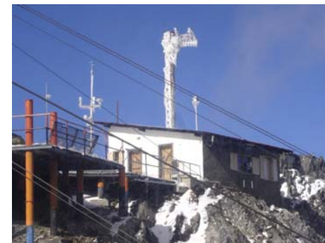
Vista de la Estación de Investigación View of the Research Station Pico Espejo Mérida, Venezuela (8.5314°N, 71.0537°W, 4765 msnm)