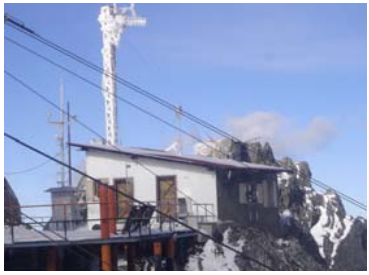
La Estación está ubicada en Pico Espejo Mérida, Venezuela The station is established on top of Pico Espejo. (8.5314°N, 71.0537°W, 4765 msnm)

En la Estación de Investigación Atmosférica de Mérida se miden varios parámetros característicos de la atmósfera desde el suelo hasta los ~80 km.