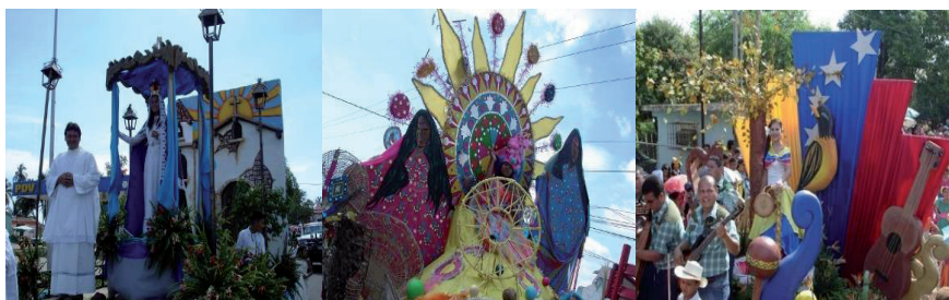
Figura 9: Feria Azul en honor a la Virgen de La Inmaculada Concepción