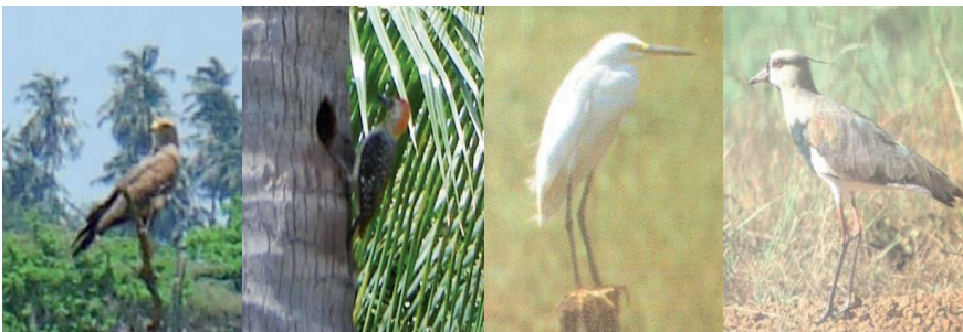
Figura 4: Especies de aves presentes en el eje urbano Chiquinquirá – La Concepción – El Carmelo

Gavilán colorado, pájaro carpintero