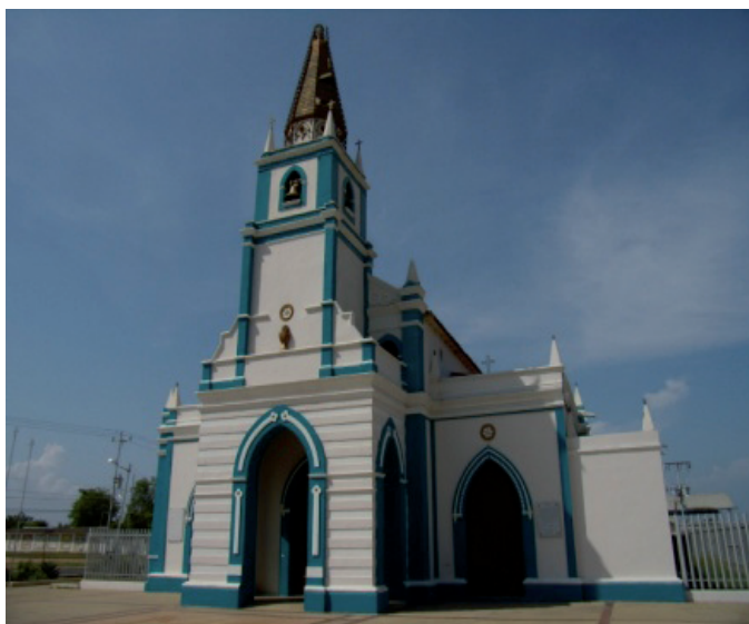
Figura 8: Iglesia Inmaculada Concepción

La iglesia San Antonio de Padua, está constituida por tres naves, con rasgos de la arquitectura neo-clásica, con cubierta de pares y nudillos. La celebración más importante es el 13 de junio, cuando se venera a San Antonio de Padua, por ser favorecedor de salud y recuperación de