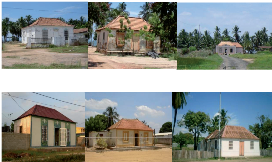
Figura 5: Casas de Hatos ubicados en el eje urbano Chiquinquirá – La Concepción – El Carmelo