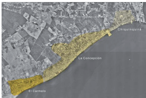
Figura 2: Fotografía aérea, eje urbano. Chiquinquirá -La Concepción - El Carmelo