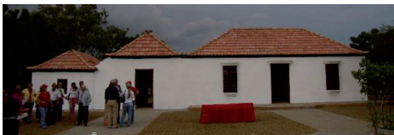
Figura 6: Casa natal del General Rafael Urdaneta. Día de la inauguración de la obra de restauración del inmueble (2007)

múltiples usos: despensa, dormitorio, espacio de descanso, etc. El área de servicios corresponde generalmente al último espacio de la vivienda, formando parte del volumen o en tinglados adosados. La Fachada principal es la más trabajada formalmente, sus elementos compositivos están organizados simétricamente, presentando variedad de alternancia y mayor riqueza en el empleo