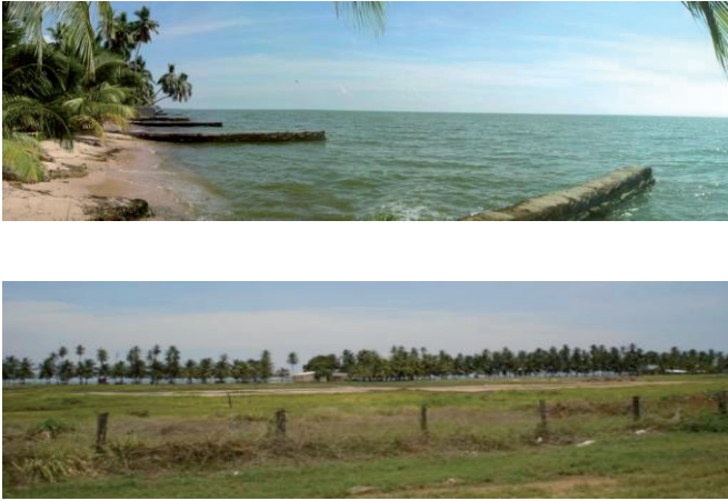
Figura 3: Borde costero y playas del eje urbano Chiquinquirá – La Concepción – El Carmelo