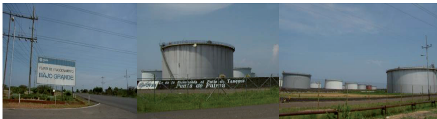
Figura 10: Vistas de la entrada a la planta de fraccionamiento Bajo Grande y del Patio de tanques de Punta de Palmas