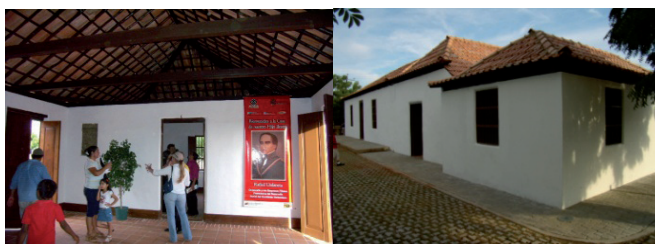
Figura 7: Casa natal del General Rafael Urdaneta Día de la inauguración de la obra de restauración del inmueble (2007)

La casa natal del General Rafael Urdaneta (Figuras 6 y 7) es una de estas casas de hatos y es conocida popularmente como “Hato Viejo”. Construido según el sistema tradicional de bahareque (estructura de horconadura con paredes de barro y caña), data de mediados del siglo XVIII.