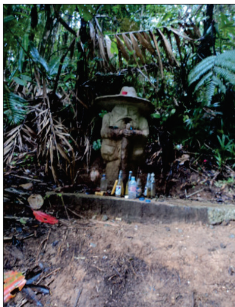
Imagen Nº 2. Escultura que representa al momoy con ofrendas de miche, chimó y velas. Laguna de Agua Negra. Fotografía: Juan Graterol (2012).

Según lo que pudimos observar, una persona bajead a puede padecer tres tipos de males: primero, enfermedades en la piel, llagas, “granos” o “sarna”; segundo, problemas motrices en brazos o piernas; tercero, desórdenes mentales o falta de energía y ánimo. Esto refleja una particular concepción de la enfermedad en la cosmovisión andina en la cual ésta no se ubica únicamente en el cuerpo biológico, también tiene un origen de carácter mágico producto de algún maleficio hecho por algunas entidades negativas 17 . Los espíritus del agua son una de estas fuerzas mágicas capaces de causar enfermedades, debido a ello las personas procuran ahuyentarlos usando “contras” o provocar una manifestación positiva de estos seres realizando ofrendas cerca de alguna corriente de agua 18 . De esta manera