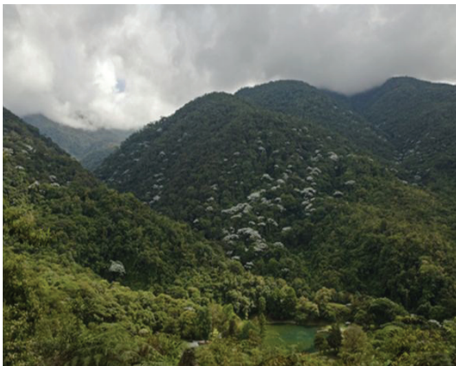
Imagen Nº 5. Parque Nacional Guaramacal. Lugar donde habita Doña Aldonza. Boconó