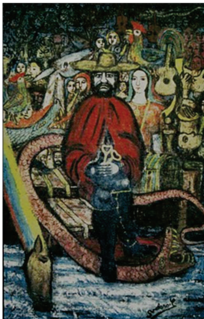
Imagen Nº 1. La Mudanza del Encanto . Autor: Salvador Valero (1957).

cronistas españoles o alguna mención en los juicios por hechicería y mojanería realizados durante el periodo colonial, no obstante, ninguno de estos registros aluden al momoy dentro de las prácticas religiosas de los cuicas u otros grupos indígenas de la región 4 .