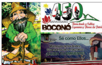
Imagen Nº 4. Representaciones del momoy asociados a Boconó y a instituciones del Estado.

Algunas instituciones como la Gobernación del estado Trujillo y la Alcaldía de Boconó usaron esta imagen en las campañas ecologistas que han llevado a cabo en los últimos años. De igual manera algunas páginas de internet y la prensa regional difunden esta visión del mito del momoy por toda la región andina. Estas campañas se observan constantemente en vallas publicitarias, murales artísticos, cuentos infantiles, artículos de prensa, producciones audiovisuales y más.