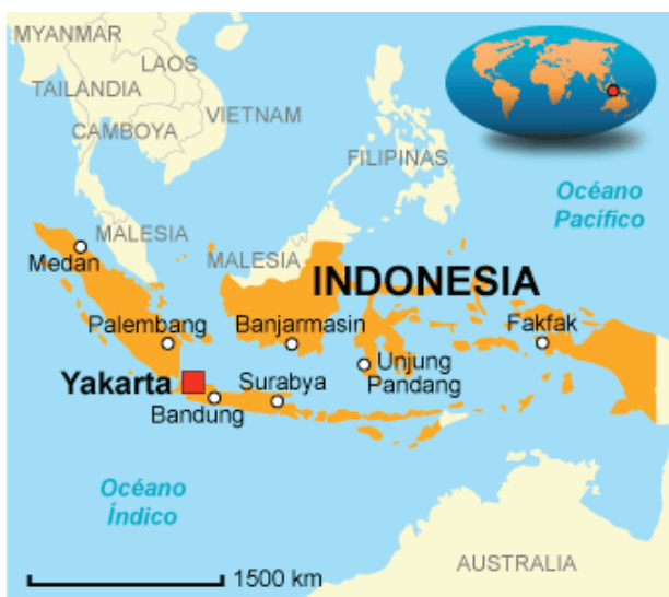
Figura 2. Contexto geográfico de la República de Indonesia.

estima que en la República de Indonesia hay una variedad lingüística que supera las 500 lenguas, entre las cuales figuran, como las más importantes, por el número de hablantes, el javanés, el sondanés y el minangkabau (Figura 2).