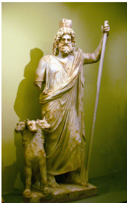
Ilustración 1. Hades y Cerbero. Museo Arqueológico de Creta

lo inanimado es el cuerpo físico, mientras que lo animado, el ánima , es lo que pervive, el alma. Las almas transmigran, idea que también defiende, en el ámbito romano, Ovidio, Salustio y Virgilio 4 . Este último autor señala que el alma, al morir, ascendía por mediación del aire, para luego atravesar las aguas que había sobre el aire y, al fin, recorrer la atmósfera que está expuesta a los rayos solares. Tal viaje suponía una purificación del alma mediante los elementos, el aire, el agua y el sol (fuego), de modo que pudiese lograr estar limpia (purificada) para acceder al Elíseo 5 . En el Elíseo podía permanecer o también ser conducida al Leteo (olvido), para afrontar una nueva existencia terrenal.