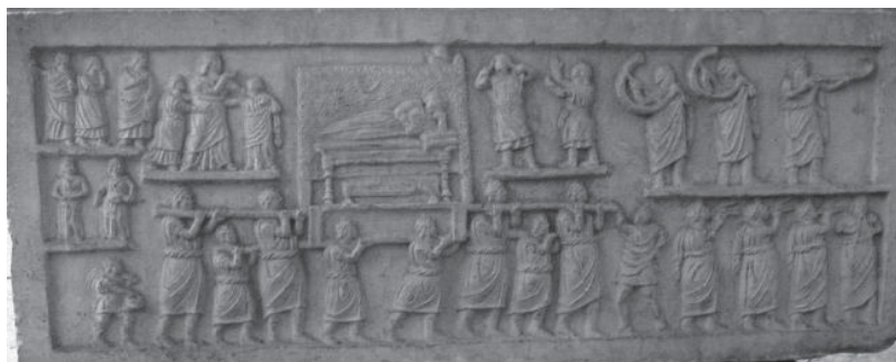
Ilustración 3. Relieve en mármol de Amiternum en la que se representa la pompa funebris de un entierro. Museo Aquilano, siglo I a.e.c.

La tumba definitiva se consagraba con el sacrificio de una cerda ( ilustración 4 , en la página siguiente). Una vez que el sepulcro estaba ya finalizado y todo dispuesto se llamaba tres veces al alma del difunto para que pudiera entrar en la morada que se le había preparado para su nueva vida. Después del entierro se levantaba una estatua del difunto en un lugar visible de la casa, dentro de en una hornacina de madera.