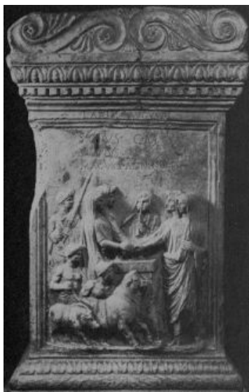
Ilustración 4. Ara de los Vicomagistri, del vicus Aesculetus (fines del siglo I a.e.c.).

Los magistrados (cuatro por cada vicus o barrio), eran elegidos anualmente para organizar las ceremonias sacrificiales asociadas a los Lares Compitales , a los que se ofrecía un cerdo, y al Genius del princeps , al que iba destinado un toro. La inscripción habla del año noveno desde la reorganización de este culto por Augusto. A la derecha los magistrados con la cabeza cubierta, indicando una función sacerdotal. También se observa un músico con aulós . Abajo, los animales para el sacrificio.