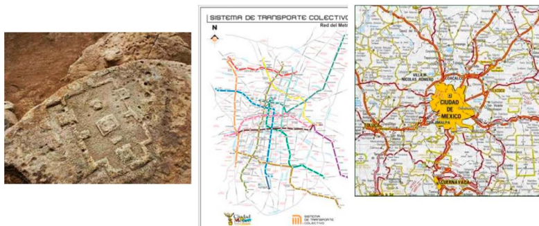
Representaciones espaciales: maqueta de Plazuelas (Pénjamo, Guanajuato), mapas de la Ciudad de México.