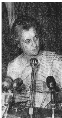
Durante media hora, la señora Gandhi contestó a 27 preguntas de los reporteros capitalinos.