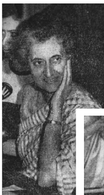
El Primer Ministro se mostró por los conceptos occidentales y